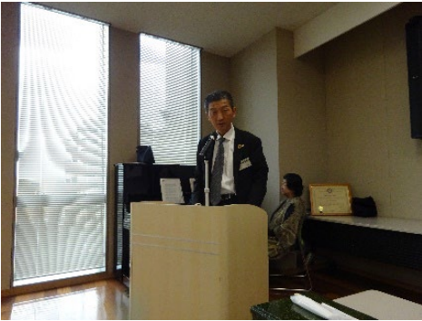
<例会運営委員会 委員長 日吉会員>