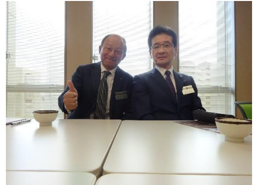
<福本会員・森實会員>