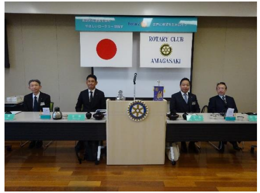
<会長・幹事 * 副会長・副幹事>